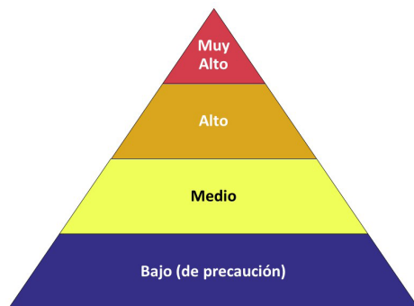
Pirámide de riesgo ocupacional para el COVID-19

El riesgo de los trabajadores por la exposición ocupacional al SARS-CoV-2, el virus que causa el COVID-19, durante un brote podría variar de un riesgo muy alto a uno alto, medio o bajo (de precaución). El nivel de riesgo depende en parte del tipo de industria, la necesidad de contacto a menos de 6 pies de personas que se conoce o se sospecha que estén infectadas con el SARS-CoV-2, o el requerimiento de contacto repetido o prolongado con personas que se conoce o se sospecha que estén infectadas con el SARS-CoV-2. Para ayudar a los empleadores a determinar las precauciones apropiadas, OSHA ha dividido las tareas de trabajo en cuatro niveles de exposición a riesgo: muy alto, alto, medio y bajo. La Pirámide de riesgo ocupacional muestra los cuatro niveles de exposición a riesgo en la forma de una pirámide para representar la distribución probable del riesgo. La mayoría de los trabajadores norteamericanos probablemente estarán en los niveles de riesgo de exposición bajo (de precaución) o medio.